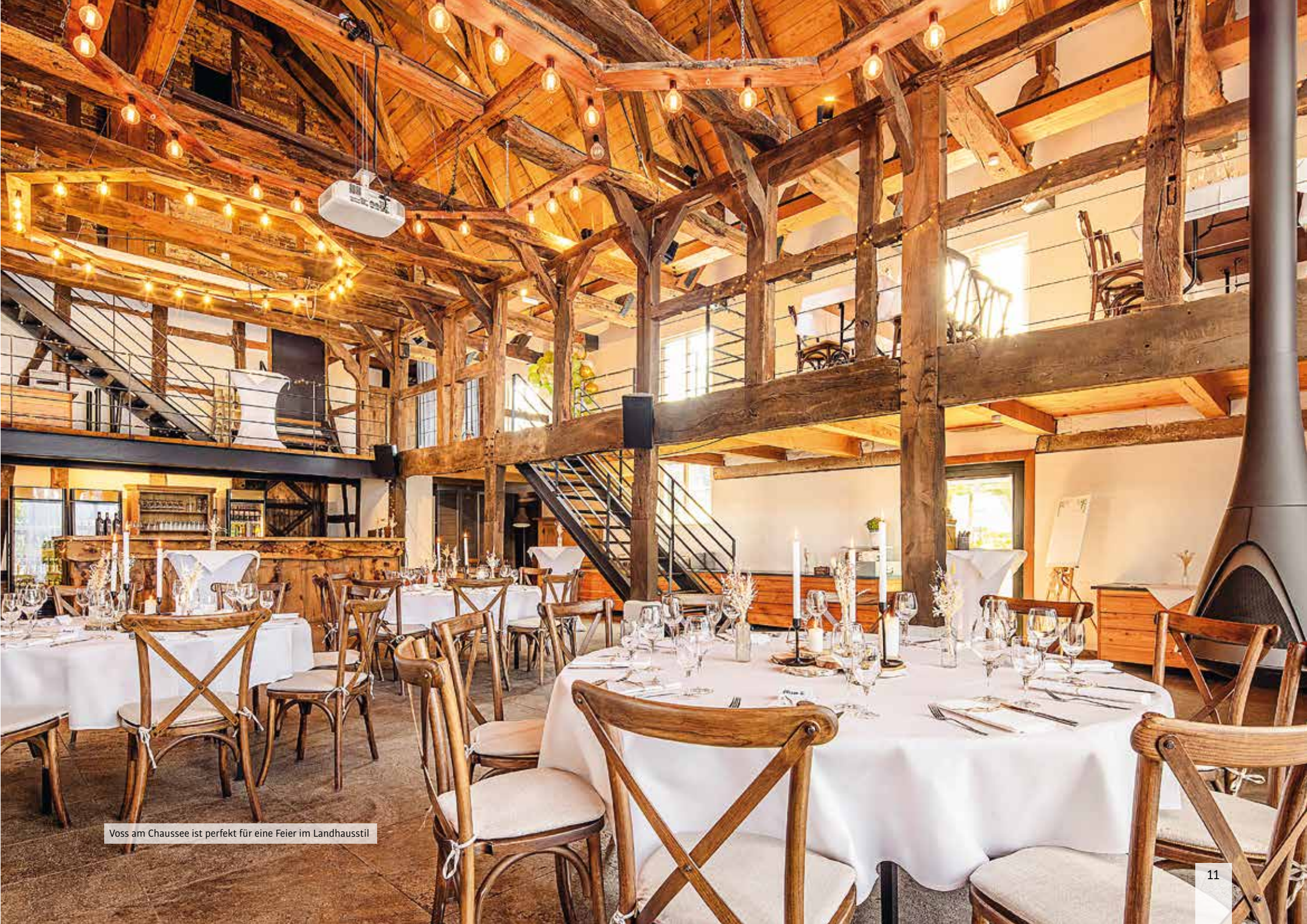
Voss am Chaussee ist perfekt für eine Feier im Landhausstil