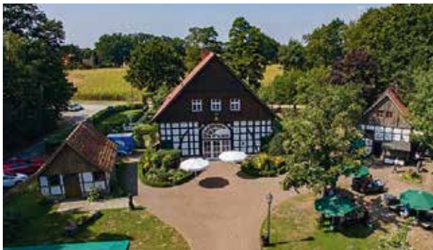
Das gastliche Dorf, Delbrück, 60 bis 300 Personen