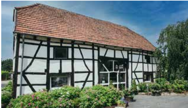
Festdeele Waltrip, 35 bis 140 Personen

Weitere außergewöhnliche Veranstaltungsorte finden Sie auf www.stolzenhoff.de