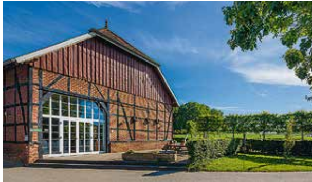
Hof Bleckmann, Werne, 40 bis 140 Personen