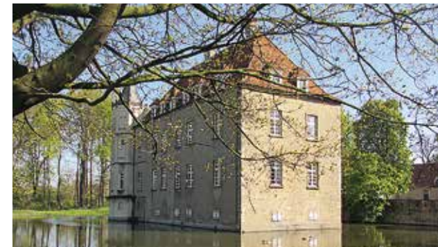
Schloss Heeren, Kamen, 70 bis 120 Personen