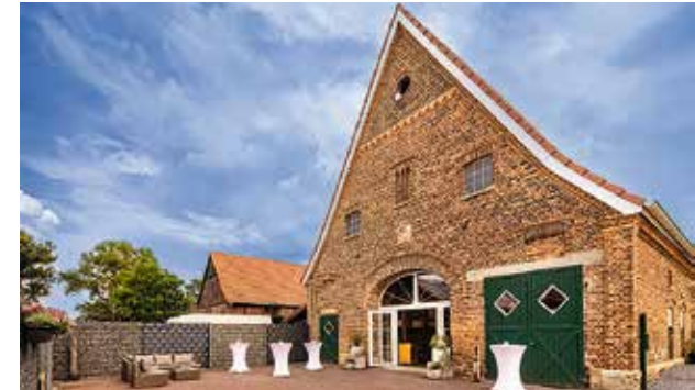
Gut Eickholt, Werne, 40 bis 90 Personen