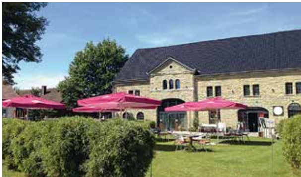
Landgut Mawick, Werl, 45 bis 110 Personen